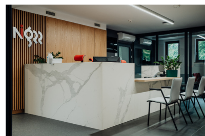
EVENT (13 of 341)