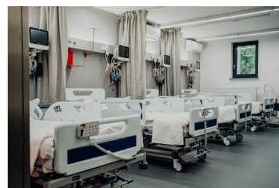
EVENT (26 of 341)

W ośrodku łączone są wysiłki klinicystów, farmaceutów i specjalistów z dziedziny biologii molekularnej a pacjenci biorący udział w badaniu klinicznym są otoczeni specjalistyczną opieką i otrzymują wsparcie również po jego zakończeniu. Celem CWBK jest stanie się oczywistym wyborem dla dzisiejszych badaczy – zarówno lekarzy z bogatym doświadczeniem badawczym, jak i młodych lekarzy chcących pozyskać wiedzę i doświadczenie w prowadzeniu badań klinicznych. Dodatkowo, dzięki współpracy z innymi ośrodkami zdrowia, Centrum promuje innowacyjne terapie