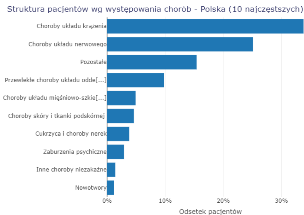
Rysunek 1 Struktura pacjentów w Polsce według występowania 10 najczęstszych chorób w opiece długoterminowej 6

Rysunek 1 prezentuje schorzenia dominujące w populacji pacjentów objętych długoterminową opieką medyczną, wskazując na najważniejsze wyzwania dla systemu zdrowotnego w Polsce.